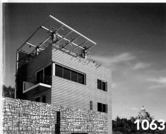
1063 SISTEMI CFS